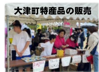
大津町特産品の販売